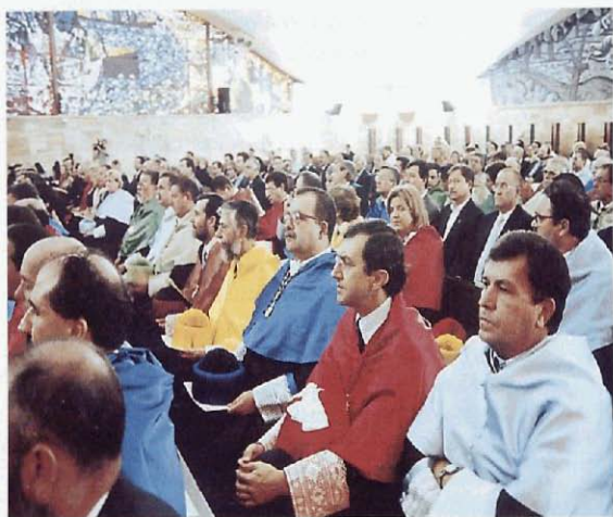
Aspecto del Salón de Actos durante la ceremonia de apertura