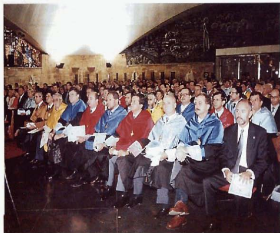
Equipo de Gobierno de la Universidad de Córdoba