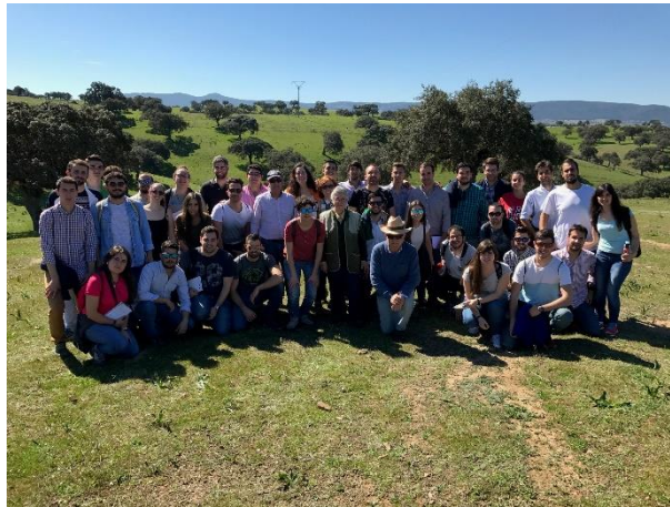
Figura 1. Visita a la explotación El Borde.

Se aprovechó esta visita para colocar collares con sensores GPS + acelerómetro a tres vacas de la explotación. Los estudiantes participaron directamente en la colocación de los collares, asesorados por un técnico de la empresa que