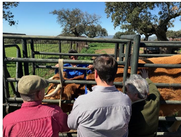
Figura 2. Colocación del collar GPS + acelerómetro por los estudiantes.

comercializa estos dispositivos: DIGITANIMAL ( www.digitanimal.com ).