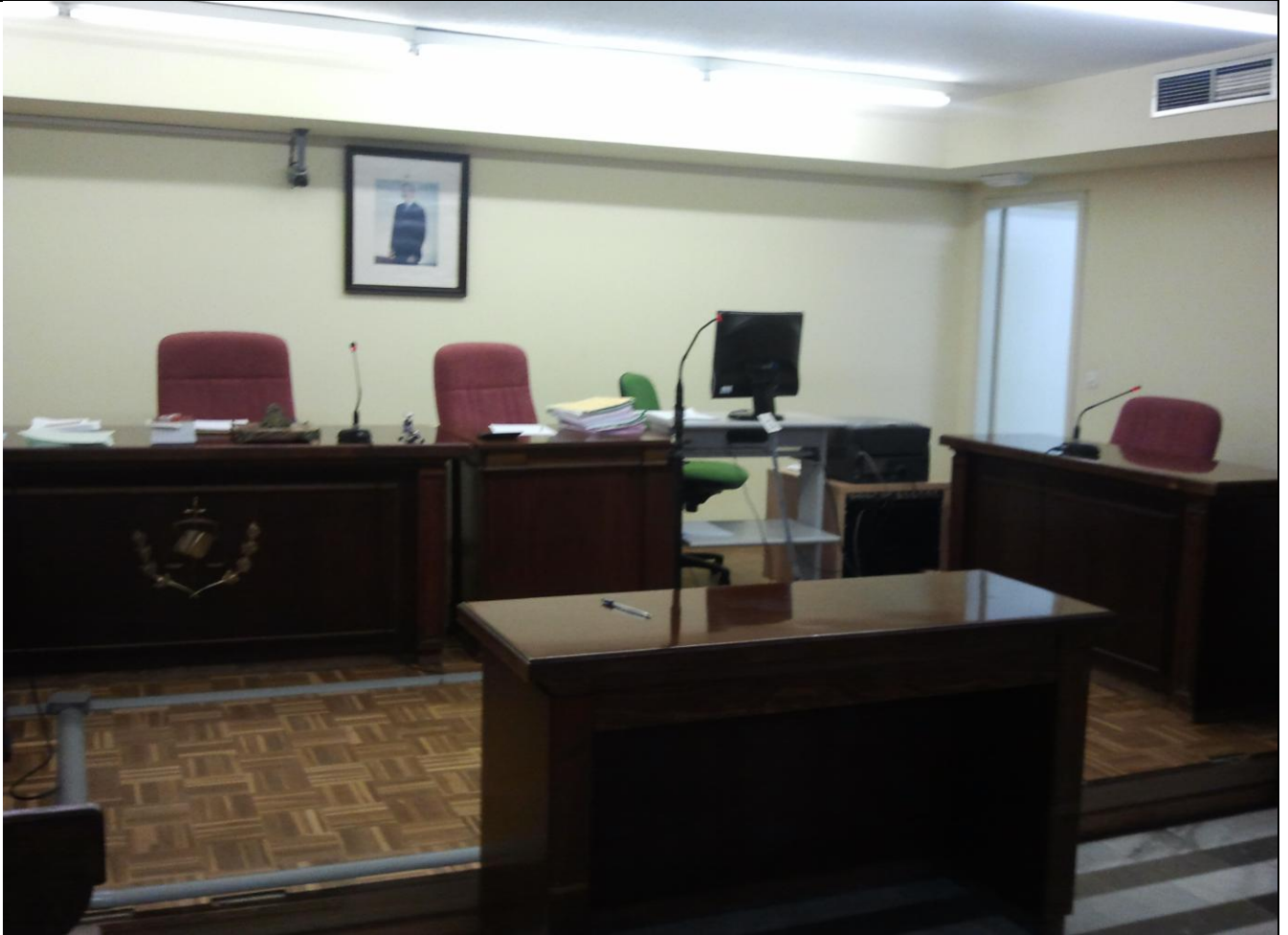
Sala de vistas. Juzgado de lo Social núm. 3 de Córdoba.